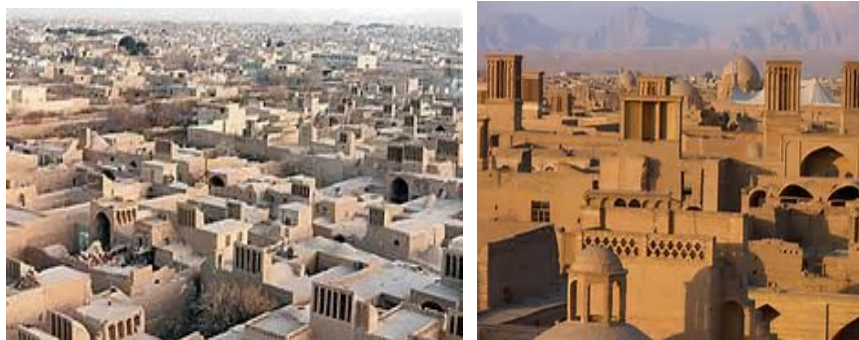
تصویر ۱- نمایش بخشی از بافت تاریخی شهر یزد متعلق به عهد قاجار (نمای از دید پرنده)

بدنه معابر و جهت حرکت خورشید و محاسبات تنظیم شرایط محیطی، آسان و خوشایند بوده است. از طرفی با تشکیل سایه‌روشن‌های زیبا با این عناصر، سیما و منظر شهری و پرسپکتیوهای زیبایی برای رهگذر خلق شده است (تصویر ۳). مناظر و سیمای شهری از دیگر مؤلفه‌های هویت کالبدی یزد بوده و مورد اشاره جکسون است.