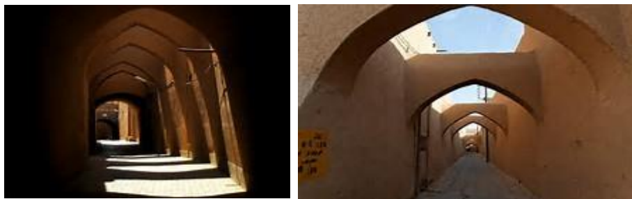
تصویر ۳- نمایش سایه‌ها و کوچه‌های سرپوشیده شهر یزد در عهد قاجار