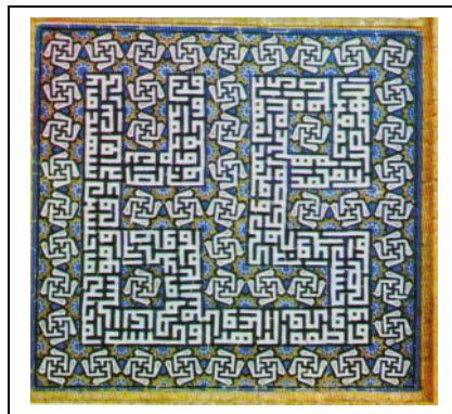
دعا در مدح دوازده امام، مسجد جامع میرچخماق، خط کوفی، دوره تیموری، ۱۴۳۷/۱۴۱۱ یزد

از ویژگی‌های مذهب شیعه در این دوره، حمایت آن از سوی فرقه‌های صوفی – شیعی بود، ممکن است وجود این گروه‌ها دلایلی بر ظهور موضوعات و عناصر شیعی در آثار هنری باشد (شایسته‌فر، ۱۳۸۴: ۴۲).