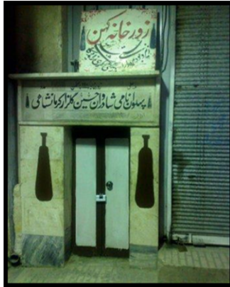
زورخانه گلزار کرمانشاهی در راسته بازار کرمانشاه (میرزایی، ۱۳۹۰)

به این پیشینه نه سقوط به ورطه کهنگی که اعتماد و تکیه است به استواری بنیان‌های ریشه‌دار کهن. بازارها اگر برای ما کالبدی فرسوده دارند و کالبد و راسته‌هایش ضعیف هستند ولی نشان‌دهنده تاریخ ماست که آرام‌آرام جلو رفته و فرهنگ، هویت و معنا یافته است. ما باید روح بازار را حفظ کنیم و کالبدش را تقویت کنیم و رابطه‌اش را با بافت مجاور برقرار کنیم. برای روشن شدن ابعاد معنای مکان در راه رسیدن به هویت، به بررسی موضوعی بازار سنتی کرمانشاه به عنوان مکانی با هویت ملی ایرانی و واجد معنا پرداخته شده است. به این منظور بازار به عنوان کل و مکان‌های تأثیرگذار به عنوان جزء در نظر گرفته شده‌اند تا بدین وسیله میزان اثرگذاری مکان بر مخاطب و عواملی که خاطره و تصویر ذهنی را می‌سازند، مشخص شود. مکان جزء (تأثیرگذار) عبارتند از: