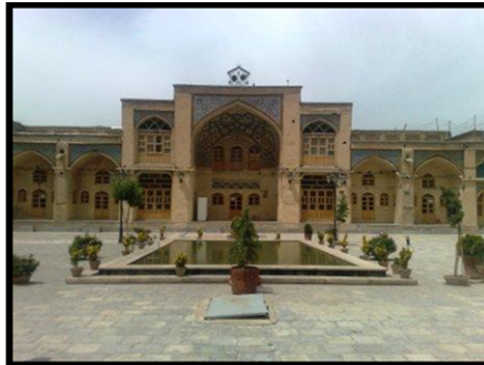
مسجد عمادالدوله در بازار کرمانشاه (میرزایی، ۱۳۹۰)