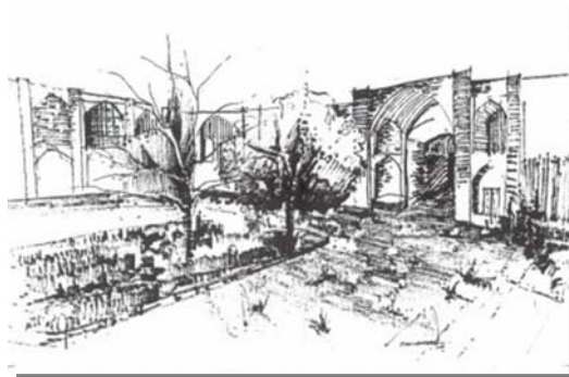
راسته بازار کرمانشاه