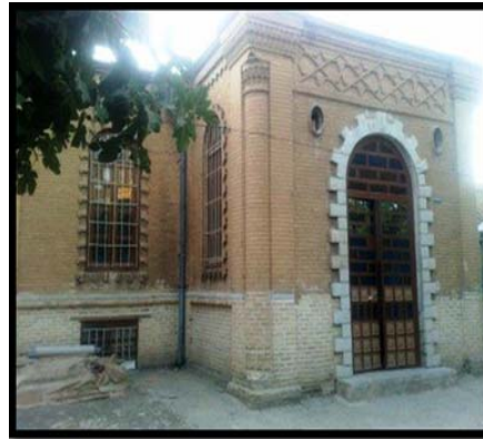
بانک غیرفعال در سرای نو در بازار سنتی کرمانشاه (میرزایی، ۱۳۹۰) راسته بازار کرمانشاه (میرزایی، ۱۳۹۰)