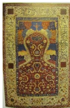
تصویر ۵: قالی با طرح محرابی