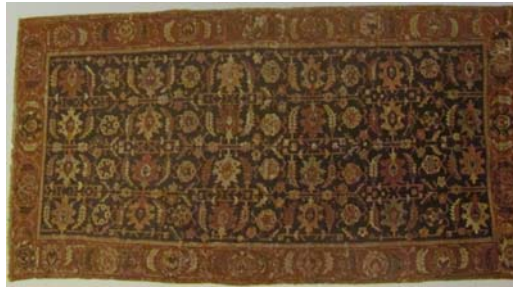
تصاویر ۸ و ۷: قالی‌هایی با طرح و نقش ماهی درهم که اصطلاحاً به طرح هراتی نیز مشهورند.