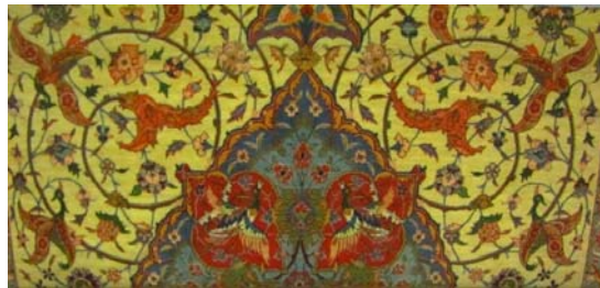
تصاویر ۹ و ۱۰: قالی با طرح و نقش اسلیمی و بخشی از نقش پیچ در پیچ و حلزونی آن، اسلیمی نمودار وحدت در کثرت و کثرت در وحدت.