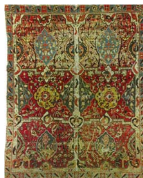
تصاویر ۱ و ۲ قالی‌هایی با طرح باغی و حضور ماهی‌ها در نهرهای جاری