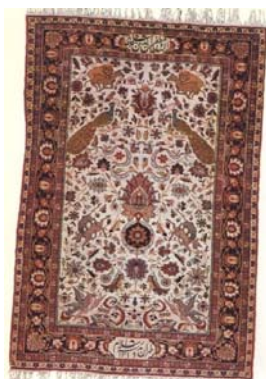
تصویر ۶: قالی با نقش طاووس