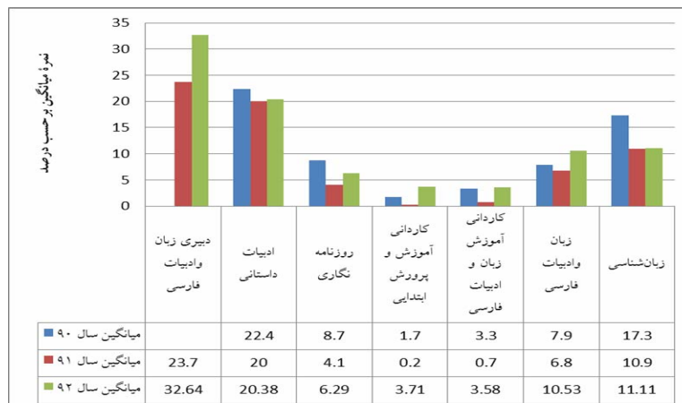
نمودار شماره ۲: میانگین نمره ادبیات تخصصی رشته‌های مرتبط (برحسب درصد)

نمودار شماره ۲، نمرات میانگین درس ادبیات در رشته‌های زبان و ادبیات فارسی و سایر رشته‌های مرتبط را برحسب درصد نشان می‌دهد.