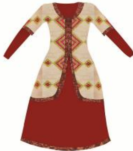
تصویر شماره 5

انتخاب پارچه، رنگ و تزئین‌های مربوط به طرح مانتو