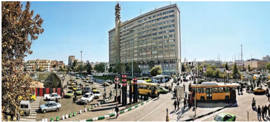
شکل ۴: میدان امام خمینی (توپخانه)