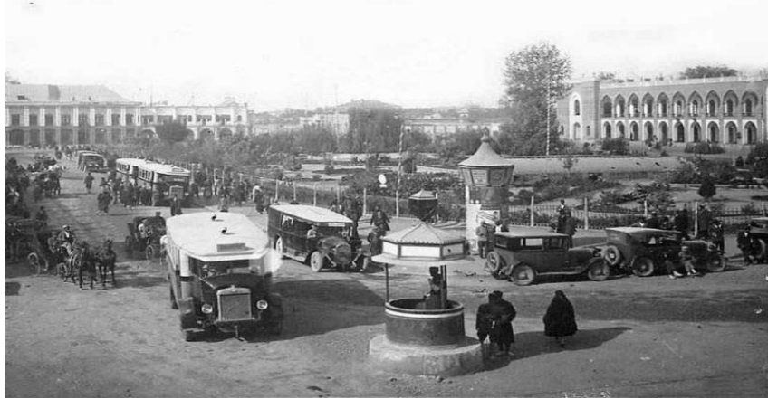
شکل ۲: میدان امام خمینی (توپخانه)، در زمان پهلوی اول (۱۳۱۰) (منبع: آلبوم خانه کاخ گلستان)