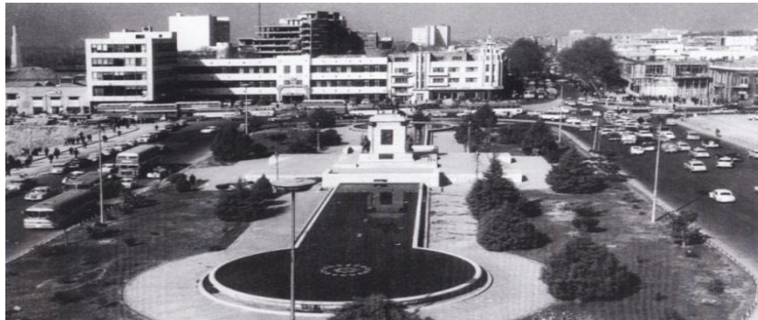
شکل ۳: میدان امام خمینی (توپخانه)، در زمان پهلوی دوم (۱۳۴۱)