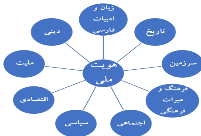
شکل شماره ۱: هویت ملی و ابعاد آن

هویت ملی در وهله نخست زاینده محیط جغرافیایی هر ملت است؛ محیط جغرافیایی تبلور فیزیکی، عینی، ملموس و مشهود هویت ملی به حساب آمده و دل‌بستگی و تعلق خاطر به سرزمین مادری که با مرزهای معین، مشخص می‌شود (گنجی، ۱۳۷۸: ۶۸). برای شکل‌گیری هویت واحد ملی، تعیین محدوده و قلمرو یک سرزمین مشخص، ضرورت تام دارد (ملکی و همکاران، ۱۳۹۵: ۶۹).