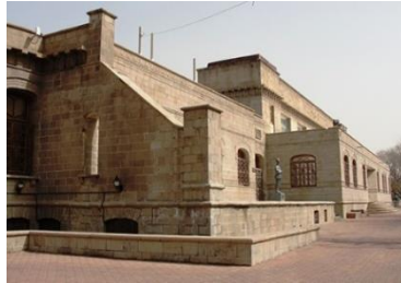
تصویر شماره ۶: کتابخانه ملی سابق تبریز

ساختمان سابق کتابخانه ملی تبریز یکی دیگر از بناهای تاریخی این شهر به‌شمار می‌رود که در ضلع شمالی باغ گلستان قرار دارد. ساخت بنای کتابخانه ملی تبریز در سال ۱۳۱۳ خورشیدی آغاز شد و در سال ۱۳۱۸ خورشیدی توسط انجمن شهر تبریز مورد استفاده قرار گرفت. از دیدگاه معماری، پلان ساختمان کتابخانه ملی سه بخش دارد، که بخش میانی به شکل سالن و بخش‌های جنوبی و شمالی به اتاق‌های مختلفی تقسیم شده‌اند. نمای بیرونی بنا از نوعی سنگ محلی به نام اسپراخون ساخته شده و سنگبری‌های به کار رفته در کل بنا، به‌ویژه در بخش‌هایی مانند طاق پنجره‌ها و کنگره‌هایی با نقش گل در انتهای دیوارها بسیار شبیه به معماری عمارت شهرداری تبریز است.