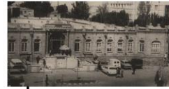
عمارت شهرانی که در دوره پهلوی دوم تخریب شد.