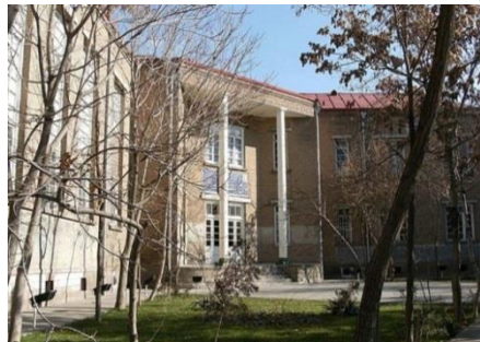
تصویر شماره ۷: ساختمان دانشسرای عالی تبریز

عملیات ساخت ساختمان دانشسرای فعلی در سال ۱۳۱۵ خورشیدی در محل سربازخانه و میدان مشق تبریز شروع شده و در سال ۱۳۱۸ خورشیدی پایان پذیرفت. گفته می‌شود در ساختمان بنای دانشسرای مقدماتی پسران تبریز، مهندسان آلمانی نیز با معماران ایرانی همکاری فنی داشته‌اند هم‌چنین این مکان به‌عنوان اولین دانشگاه تبریز فعالیت می‌کرد.