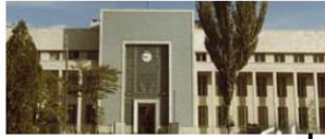
بانک ملی تبریز (شعبه مرکزی) که در دوره پهلوی دوم ساخته و به مجموعه اضافه گردید.