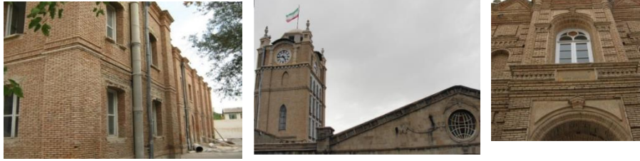
تصویر شماره ۱۰: نمای بناهای حکومتی و دولتی در دوره پهلوی، تلفیقی است از عناصر معماری سنتی و باستانی ایرانی و عناصر معماری غرب

در بناهای دیگر پهلوی اول، به خصوص مدارس، بیشتر از نمای آجری و با تزئینات آجری ساده و پنجره‌های عمودی معماری پهلوی استفاده شده است.