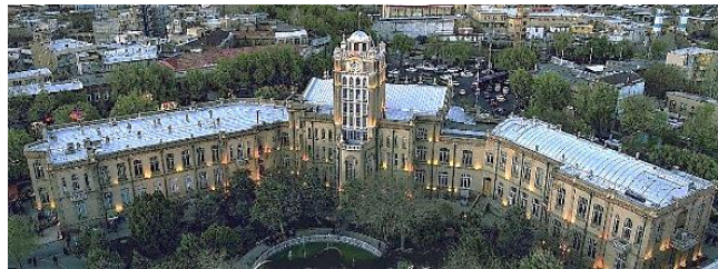
تصویر شماره ۵: عمارت شهرداری تبریز، دوره پهلوی اول، سبک نئوگوتیک

کاخ شهرداری تبریز بنایی با مساحت نه هزار و ششصد متر مربع است که به دستور رضاشاه پهلوی در محل گورستان متروک و مخروبه کوی نوبر با نظارت مهندسان آلمانی و در زمان ریاست شهرداری حاج ارفع‌الملک جلیلی انجام شد. کاخ شهرداری تبریز یک برج ساعت چهارصفحه‌ای به ارتفاع سی متر ونیم دارد. عدم وجود کاربری‌های این‌چنینی تا آن زمان موجب الگوپذیری آن از معماری روسیه و آلمان بود. معماران آلمانی ناظر بر ساخت مجموعه بودند. مجموعه به بناهای سبک «نئوگوتیک» (۱) و «نئوکلاسیک» (۲) در آن زمان اروپا شباهت دارد. در این بنا از عناصر معماری گذشته ایران در حد بسیار جزئی استفاده شده است، اما همان شباهت‌های اندک در غالب معماری غرب به نمایش درآمده است. نمای خارجی تالار شهرداری تبریز از سنگ تراشیده بوده و نقشه ساختمان آن با نمونه ساختمان‌های کشور آلمان قبل از جنگ جهانی دوم مطابقت دارد.