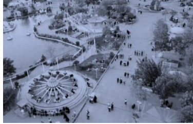
تصویر شماره ۳: باغ گلستان

پس از احداث خیابان پهلوی، اقدامات وسیعی از سال ۱۳۰۶ در زمینه بازگشایی خیابان‌های متعدد منشعب از خیابان پهلوی آغاز شد. این خیابان‌ها که بعدها به ترتیب: شاهپور جنوبی، فردوسی، منجم، خاقانی و منصور نامیده شدند در فاصله سال‌های ۱۳۱۰-۱۳۰۷ هـ.ش تکمیل شدند. در همین دوره گذر حد فاصل دروازه نوبر و دیک باشی، تعریض و به نام شهردار وقت «خیابان تربیت» نامیده شد. (بهمنش، ۱۳۸۹)