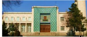
ساختمان استانداری که اکنون تبدیل به موزه شده است