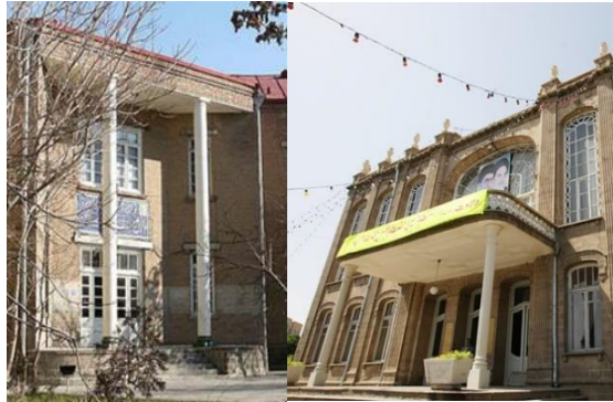
تصویر شماره ۹: ورودی بناهای حکومتی و دولتی اغلب به صورت بیرون زده و شاخص