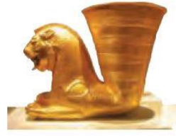
ریتون * (تکوک) شیر غزان هخامنشی

در مقابل به تعدادی از مؤلفه‌ها از جمله زیورآلات و لوح‌ها به نسبت دیگر مؤلفه‌ها کمتر توجه شده است. احمدی (۱۳۸۷) درباره‌ی زیورآلات و اشیا تزئینی می‌گوید که ساخت زیورآلات و اشیا تزئینی از هزاران سال پیش در ایران متداول بوده و به‌عنوان هنری گرانبها و ارزشمند برای اقشار مختلف جامعه تلقی می‌شده است. این ساخته‌ها در دوران مختلف از تکنیک فوق‌العاده، نقوش بیاد ماندنی و فرم‌های حیرت‌انگیزی برخوردار بوده‌اند که خلاقیت و توانمندی حیرت‌برانگیز سازندگان این اشیا را نشان می‌دهد، که با توجه به قدمت و فنون به کار رفته در ساخت آنها در کتاب‌های مطالعات اجتماعی دوره اول متوسطه کمتر به آن پرداخته شده است. مورد بعدی لوح‌ها هستند. لوح‌ها آثار ارزشمندی‌اند که از گل، قیر و دیگر مواد ساخته شده‌اند و در سطحی کوچک‌تر، کارکردی شبیه به کتیبه‌ها و نقش برجسته‌ها دارند و اطلاعات زیادی از زمان گذشته را در اختیار ما می‌گذارند.