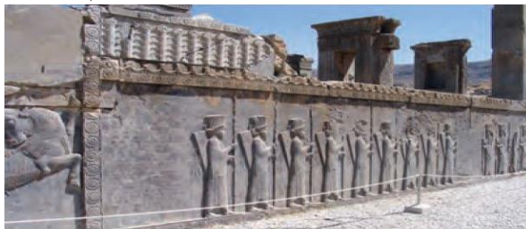
نقش برجسته سربازان سیاه چارپدان در تخت جمشید

اما در نقطه مقابل به تعدادی از مؤلفه‌ها از جمله کاروانسراها، آب‌انبارها و باغ‌های تاریخی در این کتاب‌ها توجه کافی نشده است. توسعه‌ی راه‌های تجارتي و زیارتي باعث شده که در بین جاده‌های کاروانی در سراسر کشور کاروانسراهایی برای توقف و استراحت کاروانیان بنا شود. موقعیت جغرافیایی، سیاسی، اقتصادی و مذهبی در ایران از علل ازدیاد و گسترش کاروانسراها بوده است که معماران با توجه به موقعیت اقلیمی سرزمین ایران، کاروانسراهایی با ویژگی‌های گوناگون احداث کرده‌اند (کیانی، ۱۳۹۳: ۱۳).