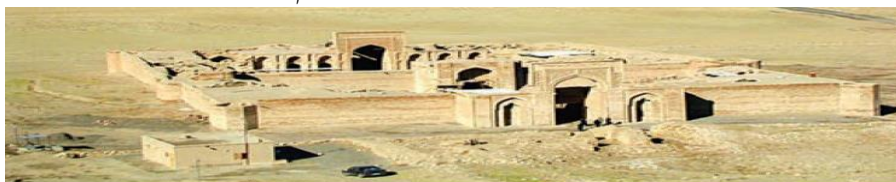
کاروانسرای سولیمان در نزدیکی سرخس (استان خراسان رضوی)

مورد بعدی آب‌انبارها هستند. موقعیت اقلیمی مناطق مختلف ایران تأثیرات زیادی در ابداعات معماری این سرزمین داشته است. از روزگاران کهن به دلیل خشکی آب و هوای بخش عمده‌ای از کشور و عدم ریزش باران کافی در کنار طرح‌های عمده‌ی تأمین آب مانند ایجاد قنات و ساختن سد، به ذخیره‌سازی آب‌های زمستانی و مصرف آن در فصل‌های کم‌آب و خشک‌سال نیز توجه شده است و آب‌انبار را به همین منظور بنا کرده‌اند (کیانی، ۱۳۹۳: ۱۶). مورد آخر باغ‌های تاریخی است. در سرزمین پهناور ایران باغ‌هایی وجود دارد که از نقطه‌نظر هنر و معماری نمونه‌های با ارزشی تلقی شده و باعث ترویج هنر باغ‌سازی ایرانی در دیگر سرزمین‌ها شده است، اما به این مورد در کتاب‌های درسی مطالعات اجتماعی با وجود این‌که باغ‌های ایرانی به ثبت جهانی یونسکو رسیده‌اند پرداخته نشده است.