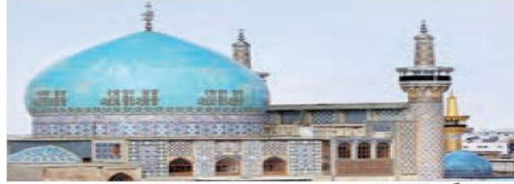
مسجد گوهرشاد، مشهد

مورد دوم مربوط به کاخ‌هاست. در گذشته مجموعه بناهایی منفرد با نوعی معماری برتر از دیگر بناها احداث می‌شد که کاخ یا قصر نامیده می‌شد (کیانی، ۱۳۹۳: ۱۲). کاخ‌ها مرکز حکومت و محل اداره‌ی مملکت به حساب می‌آمده است. در این کتاب‌ها در بین کاخ‌ها توجه بیشتر معطوف به تخت جمشید است. مورد سوم کتیبه‌ها و نقش برجسته‌ها است. کتیبه‌ها و نقش برجسته‌های مختلف و متنوعی که بر صخره‌ها و کوه‌ها کنده شده از دو بعد قابل اهمیت است، یکی بعد هنری که نشان از شاهکار حجاری آن دوره است و دیگری بعد سیاسی آن که حاکی از تحولات تاریخی دوره‌های مختلف است. با درک و اهمیت جایگاه کتیبه‌ها و نقش برجسته‌های دوره‌های مختلف تاریخی می‌توان تحولات اندیشه و مسائل فکری، فعالیت سازمان‌های دینی و حس زیبایی شناسانه جامعه را در ادوار مختلف تاریخی شناخت (علم‌الهدایی، ۱۳۹۴: ۱۰۴).